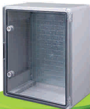
درب شفاف (PC)