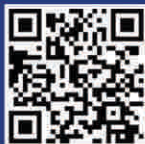
لیست قیمت | Price List