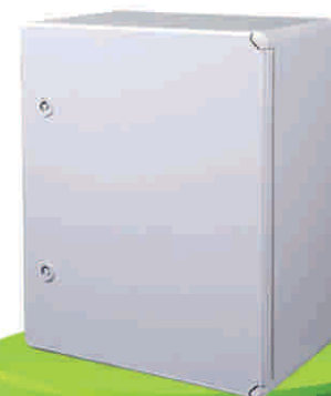
درب هم رنگ (ABS)